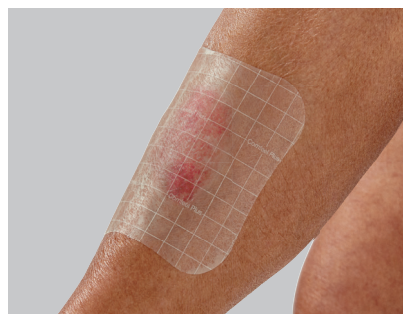
Inspection de la plaie